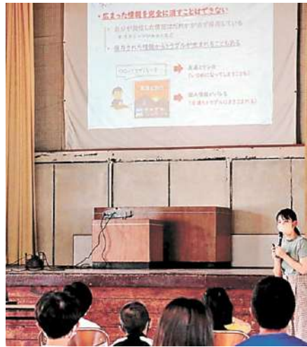
インターネットの正しい使い方などについて講演する学生。佐世保市立船越小

佐世保工業高等学校(佐世保高専)の学生3人が17日、佐世保市船越町の市立船越小でインターネットの正しい使い方について講演した。