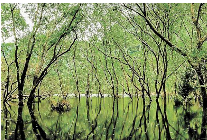
グランプリに選ばれた「memetyon.67.pic」さんの作品。佐世保市、五蔵池 (いずれも西九州新幹線開業準備委員会提供)

「おもてなし Instagram 第2回フォトコンテスト～長崎県のマイナー“映え、スポット～」の入賞作品が決まった。応募作品372点の中から、佐世保市の五蔵池を撮影した「memetyon.67.pic」さんの作品がグランプリに選ばれた。